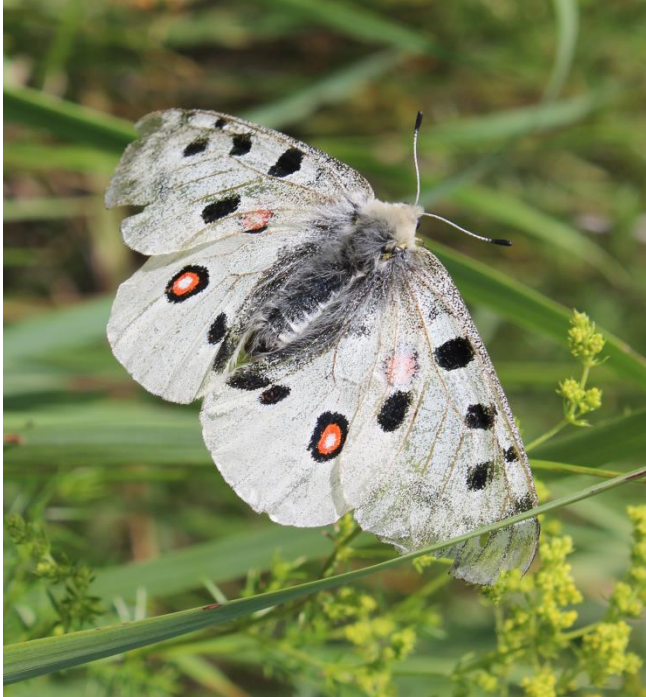
Рис. 1. Parnassius apollo meinhardi (Sheljuzhko, 1924), самец в природе, Алтайский край, Топчихинский р-н, окр. с. Сидоровка.

Предлагается незамедлительно изучить состояние популяции аполлона в Топчихинском районе Алтайского края с целью разработки стратегии его дальнейшей охраны.