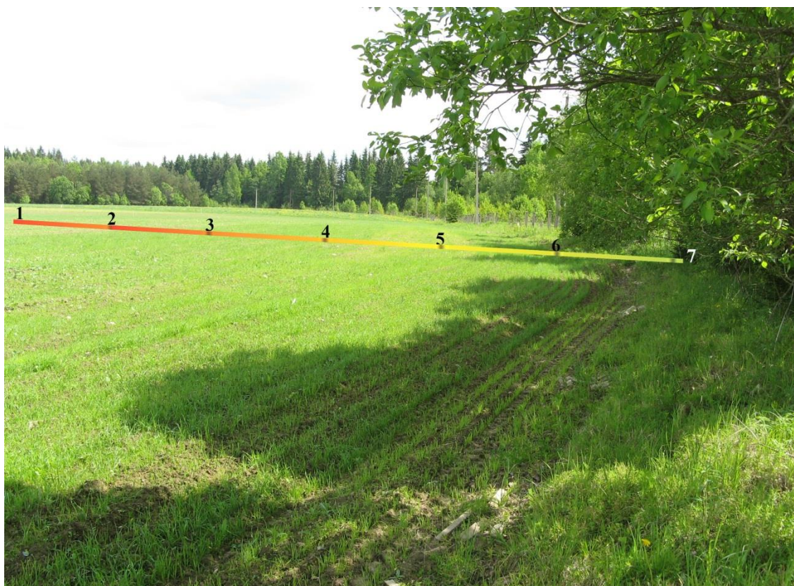
Рис. 2. Поле яровой пшеницы и обочина, места расположения ловушек 1–7.