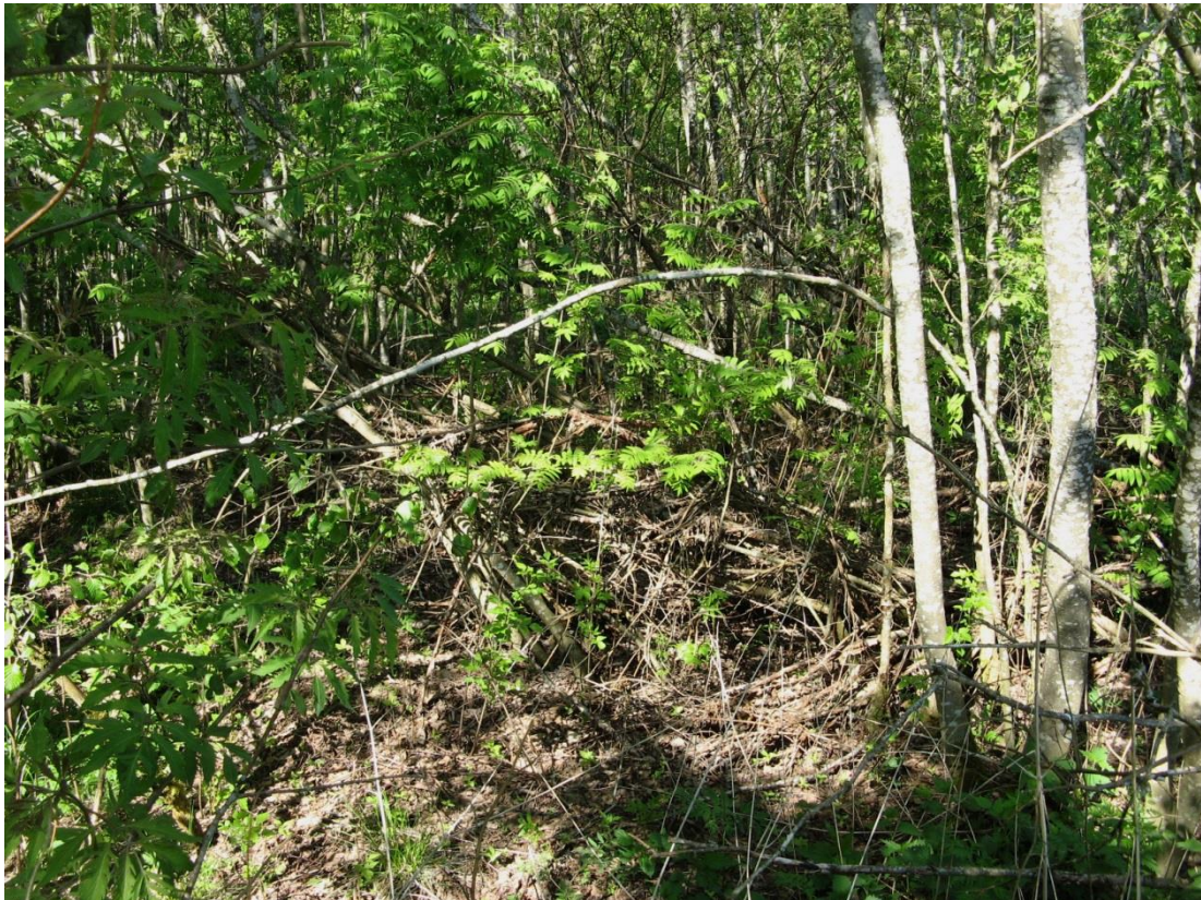
Рис. 4. Опушка леса, участок расположения ловушек 11 и 12.

Выборка ловушек осуществлялась через каждые 15 суток в период с мая по сентябрь. Определение видовой принадлежности собранных жуков проводилось автором в лабораторных условиях. Полученные по ловушкам данные пересчитывали на единицу уловистости – 10 ловушко-суток (л.-с.). Всего за 1128 л.-с. было собрано 1888 жужелиц, из них 382 относились к роду Poecilus .