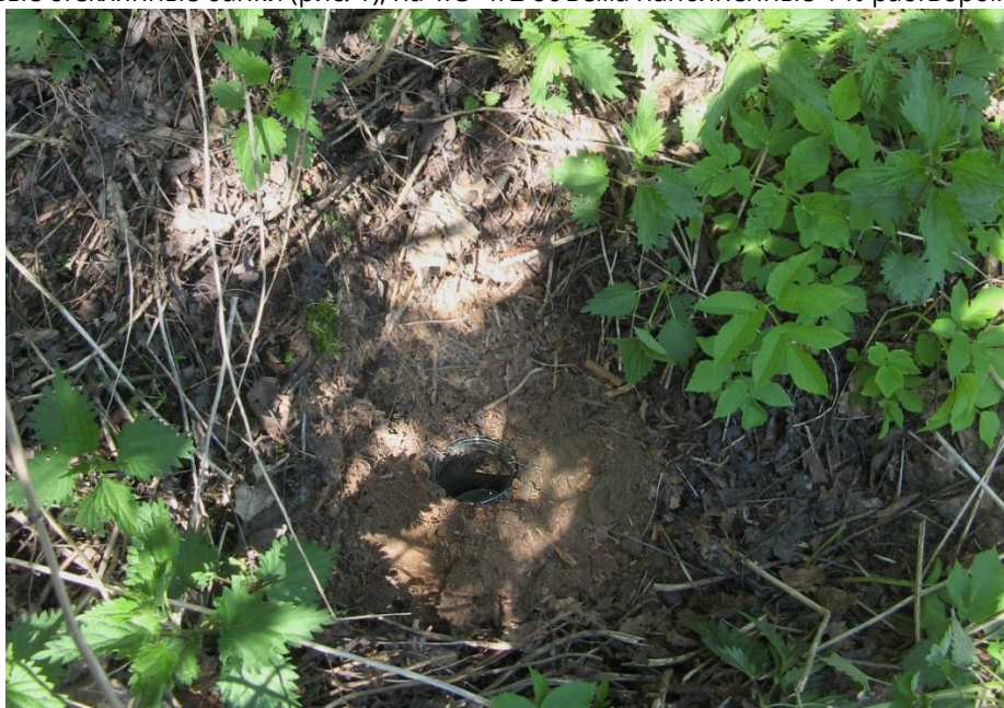
Рис. 1. Почвенная ловушка на опушке леса.

Для изучения напочвенных хищных жуков на экспериментальном участке были установлены почвенные ловушки – 0.5 литровые стеклянные банки (рис. 1), на 1/3–1/2 объема наполненные 4 % раствором формалина.