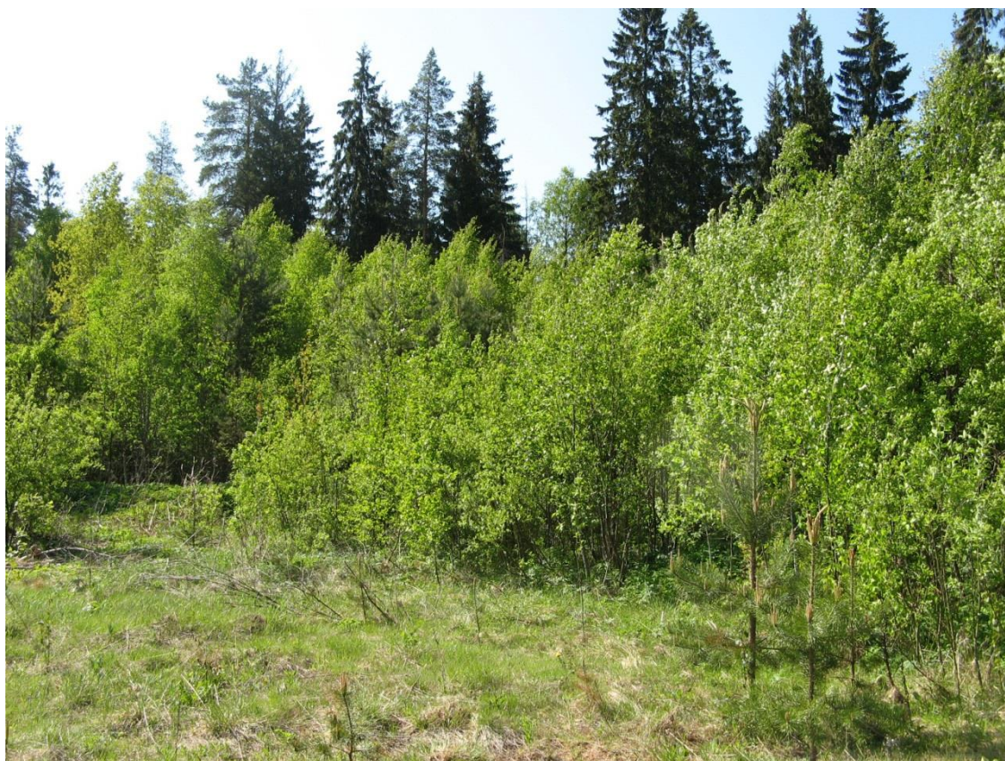
Рис. 3. Обочина поля, участок расположения ловушек 8–10.