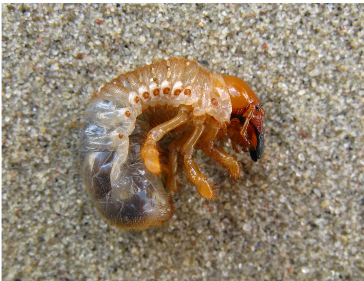
Рис. 5–6. Мраморный хрущ: (сверху) самка, темная вариация окраски; (снизу) личинка.

Суммарный улов на свет мраморного хруща в течение шести лет представлен в Табл. 4.