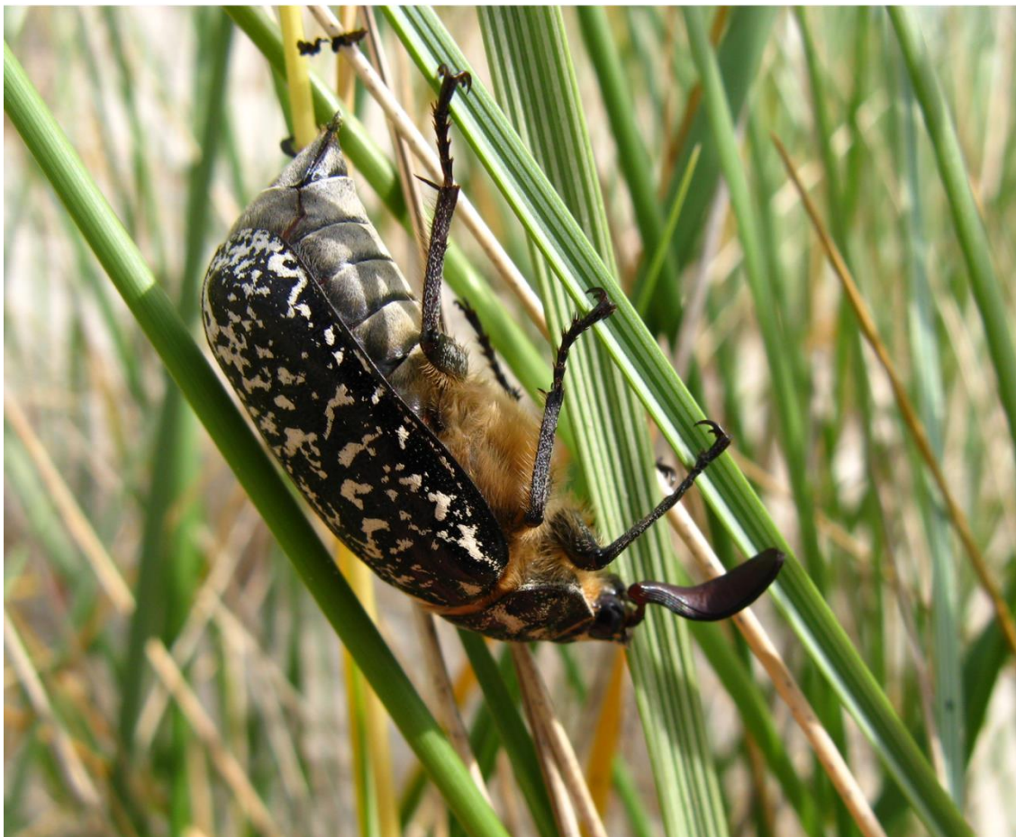
Рис. 3-4. Мраморный хрущ: (сверху) самец, светлая вариация окраски; (снизу) самец, темная вариация окраски.