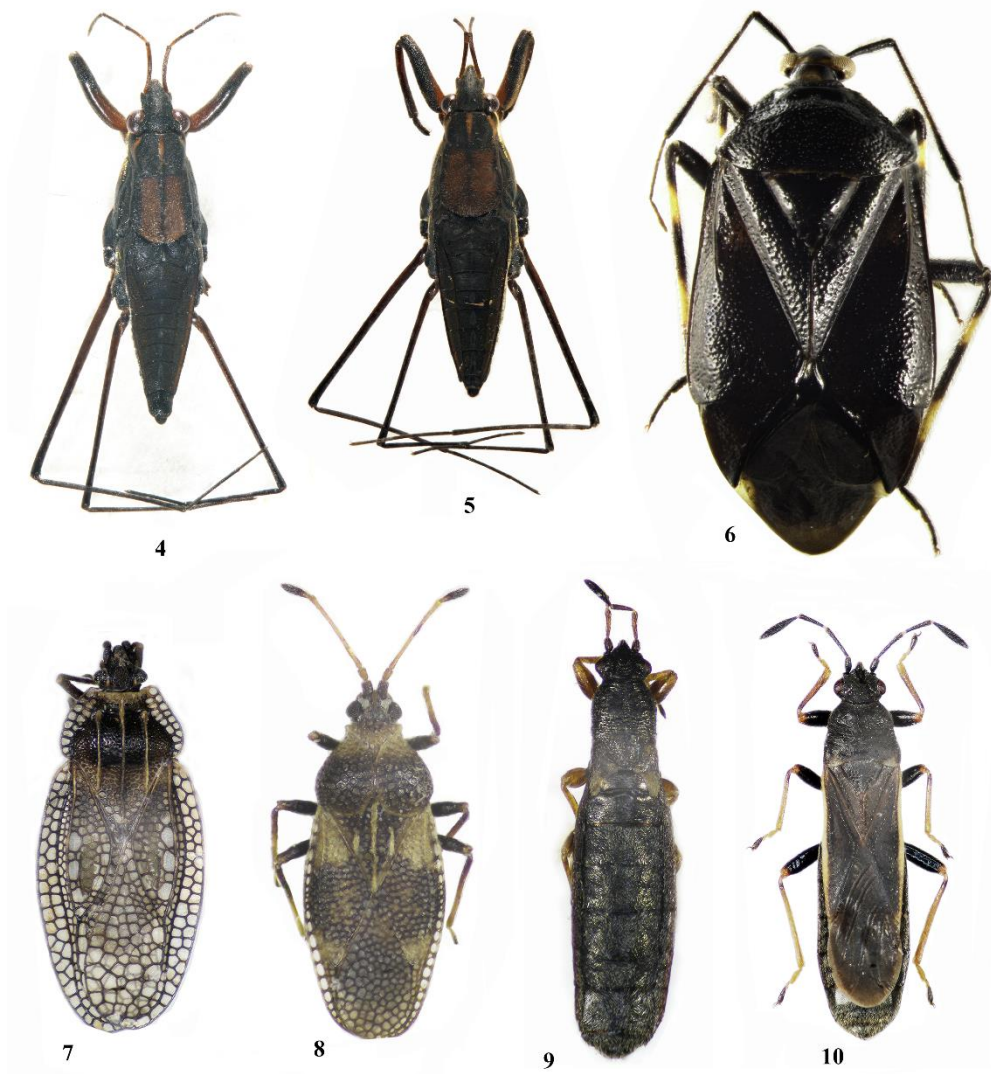
Рис. 4–10. 4, 5 – Gerris brachynotus Horv., 4 – ♂, 5 – ♀; 6 – Deraeocoris brachialis F. ♀; 7 – Kalama koreana Lee ♂; 8 – Oncochila loginovae Golub ♀; 9 – Ishnodemus alerocharoides Jak. ♀; 10 – Ishnodemus orientalis Vin. et Slater ♂ (опиг.)

Примечание. Указывается впервые из Приморского края, недавно был обнаружен на юге Якутии в истоках р. Алдан на хребте Зверева в Южной Якутии (Vinokurov, Golub, 2016). Экологически связан со сфагновыми болотами, на Северном Сахалине (Капуикова, 2003) собран в медленно текущих торфяных ручьях на сфагновом и вересково-сфагновом болотах.