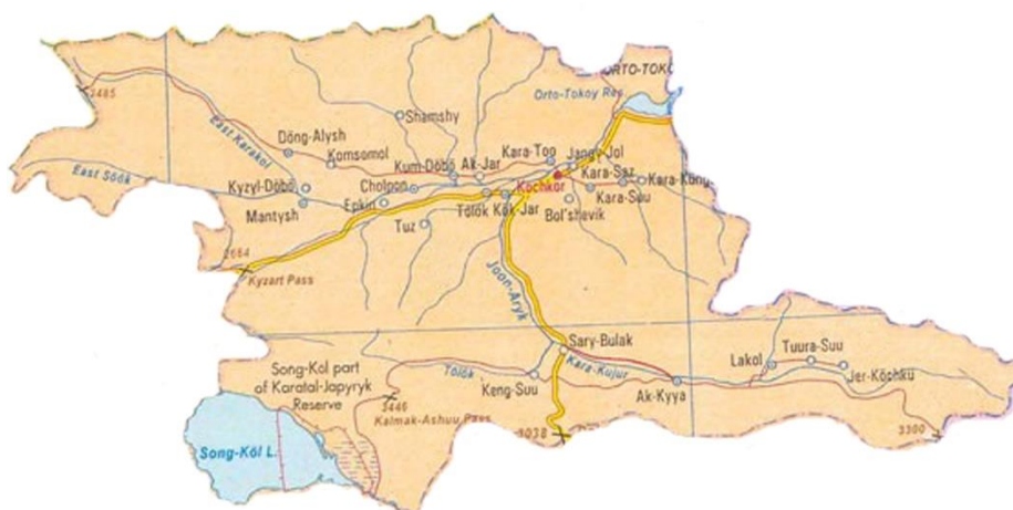
Рис. 2. Карта Кочкорского района