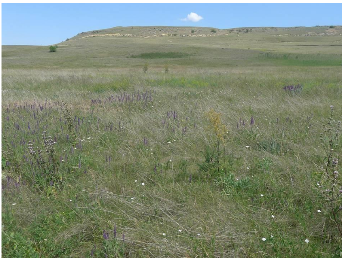
Рис. 2. Богаторазнотравно-бородачево-типчаково-ковыльная степь

Исследованная территория находится в пределах богаторазнотравно-бородачево-типчаково-ковыльной степи (рис. 2). Такая степь широко распространена на карбонатных и южно-карбонатных черноземах покатых склонов и лугово-черноземных почвах балок и потяжин.