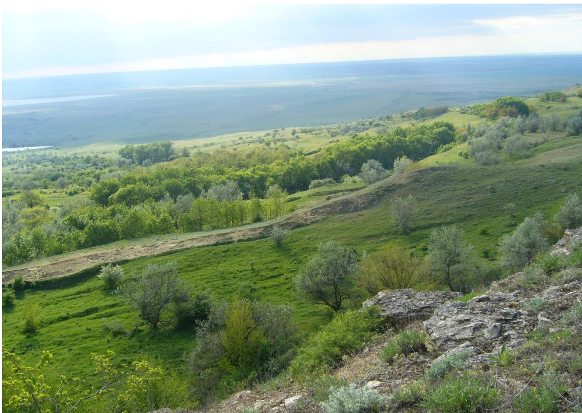
Рис. 3. Байрачный лес

Широко распространены на карбонатных и южно-карбонатных черноземах покатых склонов и лугово-черноземных почвах балок и потяжин богаторазнотравно-дерновиннозлаковые сообщества. Доминирующую злаковую синузию слагают виды Bothriochloa ischaemum , Festuca rupicola , F. valesiaca , Stipa lessingiana , S. pennata , S. borysthena , Koeleria cristata , Agropyron pectinatum , Bromopsis riparia , Bromus squarrosus , Elytrigia repens , E. elongate , Phleum phleoides , Poa compressa . Из степного разнотравья наиболее распространены Asperula humifusa , Agrimonia eupatoria , Dictamnus caucasicus , Paenonia tenuifolia , Bilacunaria microcarpa , Vicia tenuifolia , Trifolium ambiguum , Medicago romanica , Glycyrrhiza glabra , Carex supina , Potentilla recta , Ranunculus illyricus , Veronica multifida , V. spicata , Vincetoxicum hirsutinaria , Lathyrus miniatus , Galium ruthenicum , G. verum , Linum austriacum , Inula germanica , Tragopogon dasyrhynchus , Euphorbia iberica , Jurinea arachnoidea , Teucrium chamaedrys , Polygala comosa , Salvia tesquicola , Verbascum phoeniceum , Gypsophila paniculata , Centaurea ruthenica , Orchis tridentata , Iris notha .