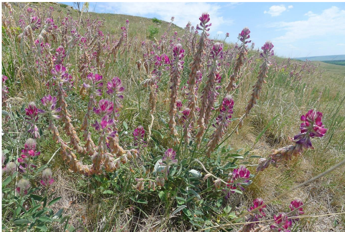
Рис. 4. Hedysarum biebersteinii

Раритетная флора исследуемого района насчитывает не менее 19 видов цветковых растений, относящиеся к 14 родам и 8 семействам (табл. 1). В составе учтённой флоры были выявлены 2 субэндемика, 9 реликтовых видов и 1 эндемик флоры Ставрополя (рис. 4-5).