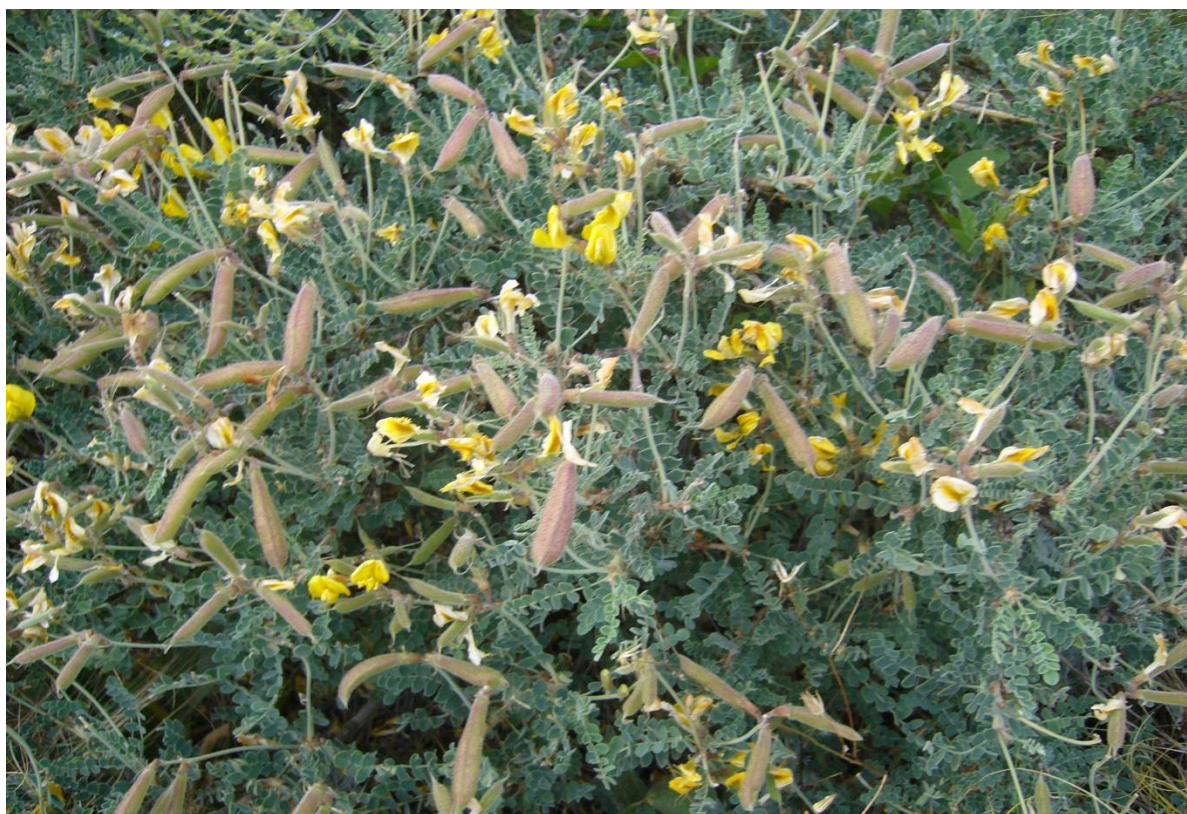
Рис. 5. Calophaca wolgarica