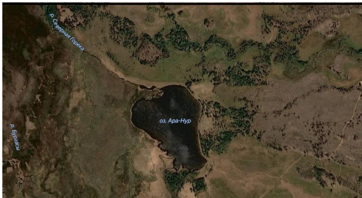
Рис. 1. Карта-схема озера Ара-Нур

В 1998-1999 гг. проводились работы по изучению разнообразия различных групп организмов бассейна р. Хилок, включая рыб. Большая часть материалов по ихтиофауне вошла в монографию (Landshaftnoe ..., 2002). К сожалению, материалы по рыбам оз. Ара-Нур находились в камеральной обработке и не были опубликованы. В связи с тем, что появились сведения о продвижении ротана по бассейну р. Хилок и образовании им единой Восточно-Сибирской области инвазионного ареала ротана Percijttus glenii Dybowski, возникла необходимость публикации данных материалов (Gorlachev, Gorlacheva, 2019). Несмотря на 20-летнюю давность этих материалов, они не утратили своего значения, так как подобных исследований на данном водоеме больше не проводилось.