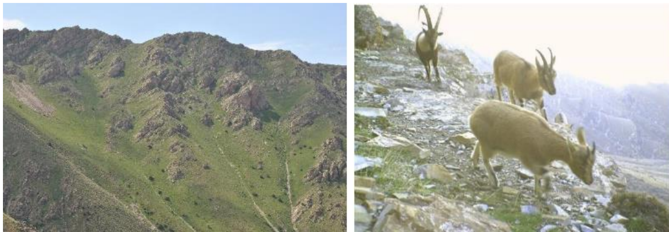
Рис. 2. Типичные местообитания безоарового козла.

Сезонные вертикальные и горизонтальные миграции стад безоарового козла в основном определяются кормовыми условиями местообитаний. Вертикальное распределение животных колеблется в пределах 600-3900 метров. По нашим наблюдениям животными для пастбы используются невысокие холмы (5,3% от общего числа кормовых биотопов), овраги (7,3%), склоны, покрытыми разнотравьем (15,3%), скалистые склоны (42,1%), скалы и впадины (30,1%).