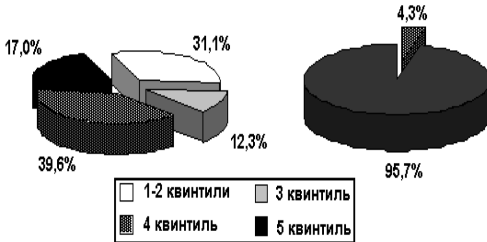
Рис. 2. Суммарный коронарный риск (%) по квинтилям у практически здоровых людей (а) и больных ССЗ (б)

Суммарный коронарный риск у практически здоровых лиц в среднем составил 12,8%, у мужчин – 13,9%, женщин 10,7%. Обнаружено, что в группе практически здоровых лиц в среднем у 31,1% обследуемых индекс коронарного риска вписывался в границы 1-2 квинтилей риска на ближайшие 10 лет ("малый риск"), у 12,3% в 3-ий квинтиль ("желательный" риск), у 39,62% индекс попадал в 4-й квинтиль, расцениваемый как "умеренный риск" сосудистых нарушений, а у 16,9% соответствовал ("высокому риску") – 5-му квинтилю (рис. 2а).