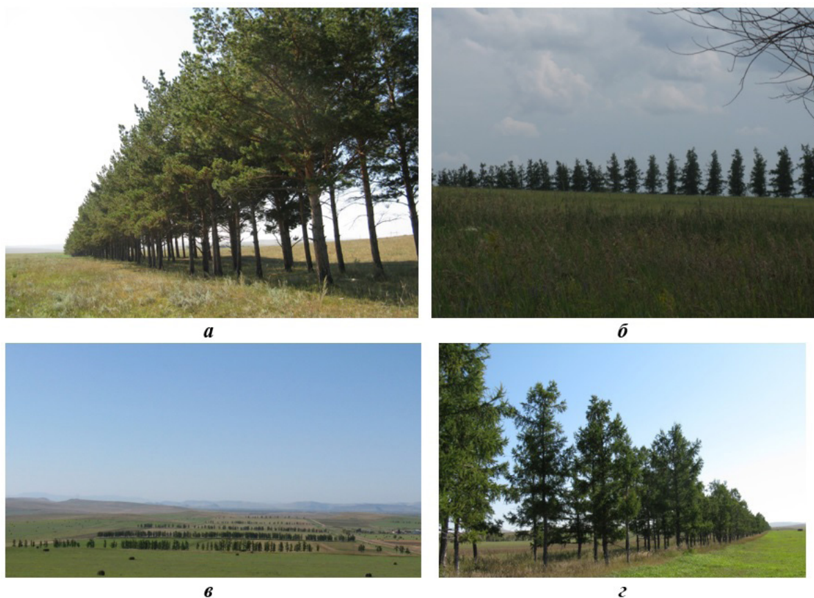
Рис. 2. Общий вид современного состояния ПЗЛП из Pinus sylvestris рядового способа посадки на чернозевовидной супесчаной почве (а), Larix sibirica шахматного способа посадки на черноземе южном легкосуглинистом (б), Larix sibirica рядового способа посадки на черноземе южном среднесуглинистом (в) и шахматного способов посадки на черноземе обыкновенном среднесуглинистом (г) через 53–58 лет после посадки на Хакасском противоэрозионном стационаре.

Краткая характеристика, показатели жизнеспособности и агролесомелиоративной эффективности обследованных лесных полос на пробных площадях представлены в таблице.