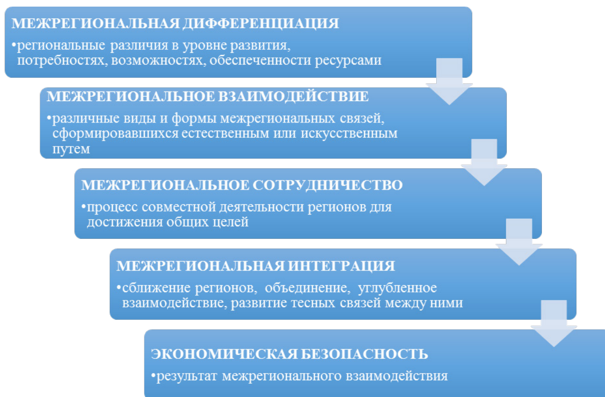
Рис. 1. Роль межрегионального взаимодействия в концепции экономической безопасности

Согласимся с мнением О. А. Бакуменко, который предлагает понимать под межрегиональным взаимодействием «комплекс обменов потоками ресурсов, осуществляемых в рамках соглашений между органами власти, юридическими и физическими лицами различных регионов, принятых де-юре или де-факто» [18]. Однако автор ограничивает цели межрегионального взаимодействия «представлением общих интересов в мировом экономическом пространстве и повышением уровня устойчивого развития регионов», что, на наш взгляд, купирует возможности получения более значимых результатов с точки зрения национальных интересов, ориентированных не только на повышение конкурентоспособности страны на мировой арене, но и на обеспечение региональной и национальной безопасности через эффективное экономическое сотрудничество и экономическую интеграцию регионов.