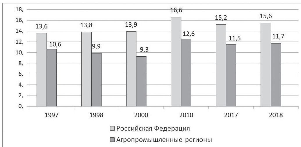
Рис. 1. Соотношение доходов 10% наиболее и 10% наименее обеспеченного населения (коэффициент фондов) в России и агропромышленных регионах в 1997–2018 гг., в размах 5

раза до 15,1) 4 . После этапа массовой приватизации с 1995 г. в стране и АПР наблюдалась уже относительная стабилизация данных показателей. В 1997 г. коэффициент фондов в АПР зафиксирован на отметке 10,6 раза, что было заметно ниже аналогичных среднероссийских показателей — 13,6 раза (рис. 1, табл. 2).