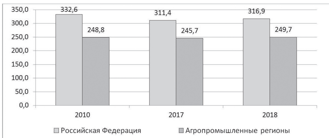
Рис. 3. Соотношение среднедушевых денежных доходов населения с величиной прожиточного минимума в Российской Федерации и агропромышленных регионах в 2010–2018 гг., % 4

В период 2010–2018 гг. соотношение среднедушевых денежных доходов жителей АПР с величиной прожиточного минимума в этих регионах (ПРМ), отражающее по сути покупательную способность таких доходов, в целом практически не изменилось — 248,8 и 249,7% от бюджета ПРМ (рис. 3). Но в годы кризиса наблюдалось снижение данного показателя (245,7% в 2017 г.), наиболее значительное — в 2015–2016 гг. В 2018 г. покупательная способность доходов жителей АПР составила 78,8% от среднероссийского уровня, то есть отставание АПР с 2010 г. сократилось с 25,2 до 21,2%.