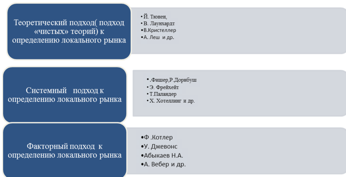
Рис. 1. Подходы к определению сущности локального рынка [3]

Теория В. Кристалпера о функциях и размещении системы населенных пунктов (центральных мест) в рыночном пространстве (зоны сбыта); теория А. Леша об экономическом регионе как рынке с границами, обусловленными межрегиональной конкуренцией и др., позволило ряду ученых систематизировать научные подходы к определению локального рынка [3] (рис. 1), где используются лишь отдельные подходы и методы в изучении рынка с одновекторным учетом факторов влияния.