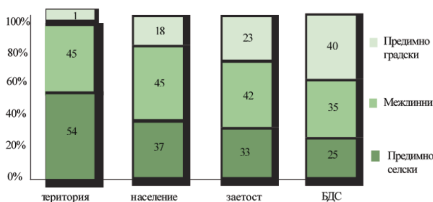
Рис. 1. Население, ВВП и занятость по типам районов (2010 г.)

В 2010 г. в экономике, в основном сельской местности, было создано 25% валовой добавленной стоимости (ВДС) Болгарии, что обеспечено 33% занятости (см. рис. 1).