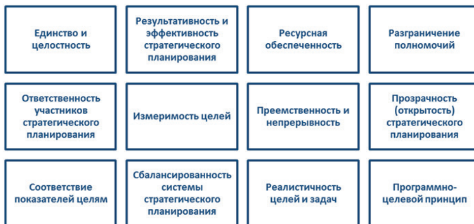
Рис. 3. Принципы организации и функционирования системы стратегического планирования

— Распоряжение Правительства РФ от 13.02.2019 г. № 207-р «Стратегия пространственного развития РФ на период до 2025 года», определяющая приоритетные и приграничные геостратегические территории России [3].