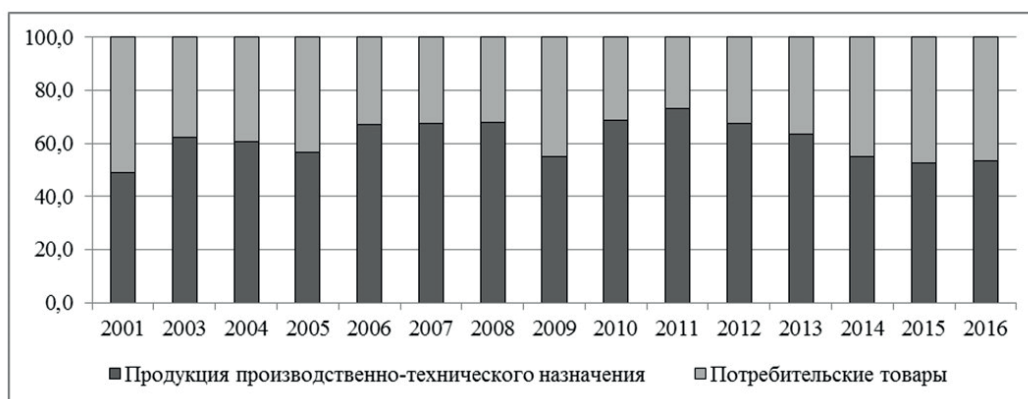
Рис. 3. Динамика товарной структуры вывоза продукции из Алтайского края в регионы России в 2001–2016 гг., %.

Развитие межрегиональной торговли, как отмечалось ранее, имеет под собой объективную основу, обусловленную сложившейся специализацией регионов. В силу последней производство многих непродовольственных потребительских товаров (бытовой техники, электронной аппаратуры), а также продукции производственно-технического назначения (нефтепродуктов, химической продукции, станков, оборудования, легковых машин и пр.) сосредоточено в нескольких регионах России.