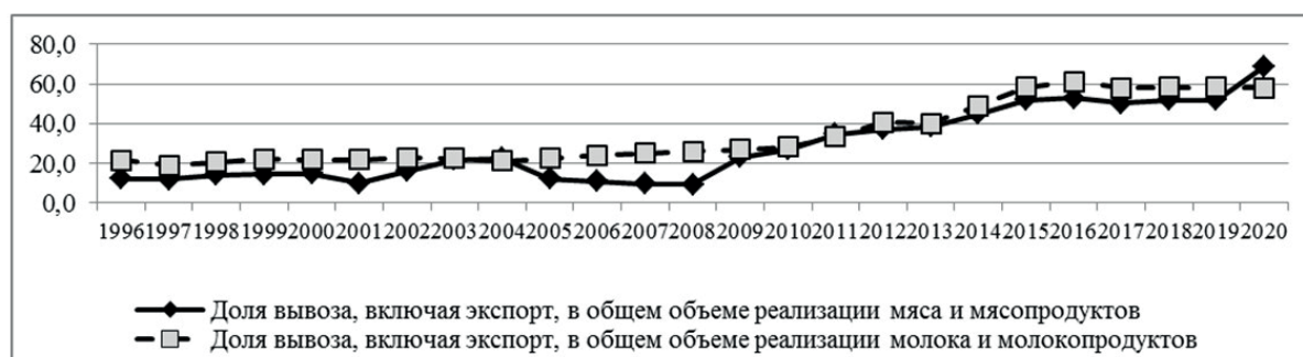
Рис. 5. Роль внешних рынков в росте спроса на мясные и молочные продукты, произведенные в Алтайском крае,%.

Особая значимость внешних рынков для поддержки и роста производства в крае мясной и молочной продукции видна на рисунке 5. Он наглядно свидетельствует о том, что наращивание производства в Алтайском крае мяса и мясопродуктов, молока и молокопродуктов все в большей мере детерминировано спросом на эту продукцию на межрегиональных и зарубежных рынках.