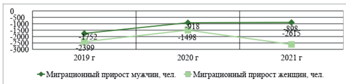
Рис. 3. Динамика миграционного оттока по гендерному составу в Алтайском крае в период с 2019–2021 гг., чел.

На протяжении трех последних лет край в большей степени покидали женщины. На каждого уехавшего из региона мужчину в 2021 г. приходились три уехавшие женщины. В целом динамика такова: наблюдается значительное сокращение уезжающих из региона мужчин (– 48,7%), на фоне растущего числа женщин (+ 9%), покидающих регион.