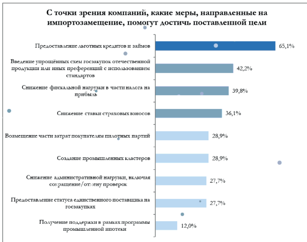
Рис. 3. Актуальность мер, направленных на импортозамещение [8]

Более двух третей опрошенных предпринимателей считают самой эффективной и востребованной мерой поддержки по замещению импортной продукции на российском рынке предоставление льготных кредитов и займов (рис. 3).