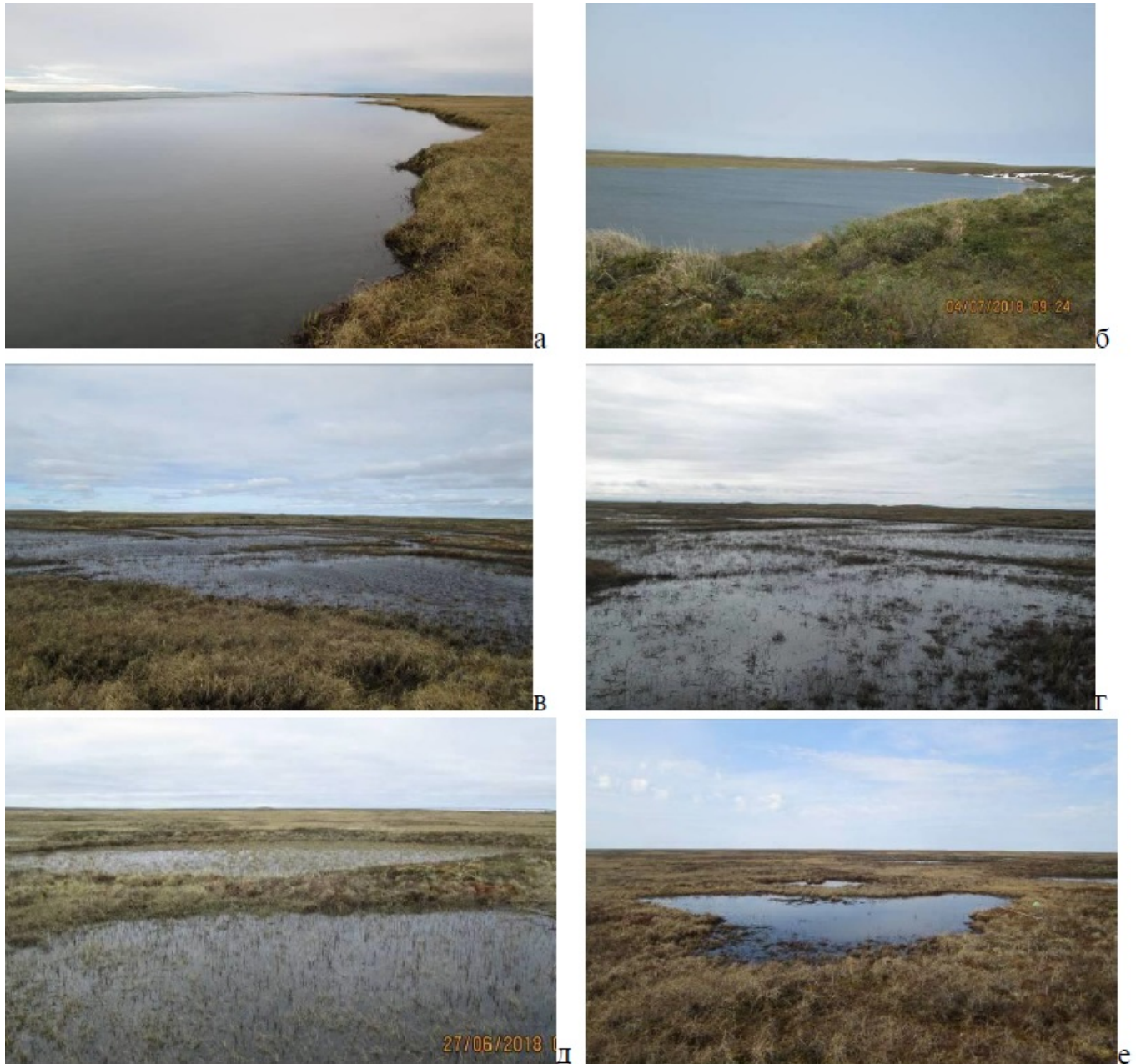
Figure 2. Рис. 2. Исследованные водоёмы: озера (а-б), осоково-гипновые болота в понижениях (в-г), мелкие тундровые водоёмы (д-е) Fig. 2. Investigated reservoirs: lakes (a-b), sedge-hypnoid bogs in depressions (в-г), small tundra reservoirs (д-е)

влагалищнопушицевой тундр. Имеют различные контуры в зависимости от форм трещин и бугров, площадь одного водоема в среднем 2,2 \times 10^{-5} км 2 , глубина - 0,27 м. Исследованные нами группы включают от 7 до 20 водоемов, средняя площадь группы около 35 \times 10^{-5} км 2 . На буграх толстый мохово-лишайниковый покров из видов Cetraria , Aulacomnium , Sphagnum , среди которых произрастают осоки, подбел, береза, ивы ( Salix ), багульник стелющийся ( Ledum decumbens ), брусника ( Vaccinium vitis-idaea ).