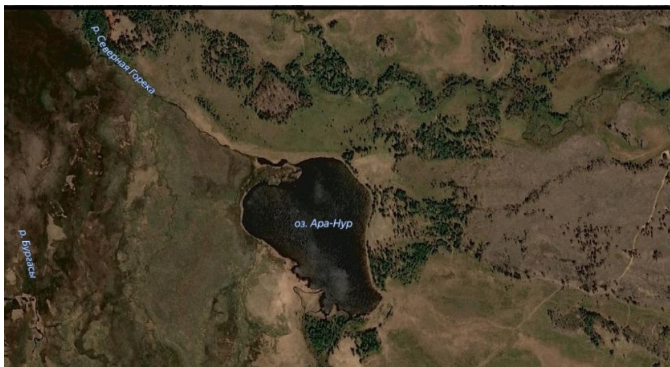
Figure 1. Карта-схема озера Ара-Нур

(рис. 1). В период Самарского похолодания 300-230 тыс. л. назад происходило формирование песков Забайкальской серии. В период Тазовского похолодания 250-130 тыс. лет назад шло интенсивное промерзание песков Забайкальской серии; 150-90 тыс. лет назад интенсивно проходили термокарстовые процессы и деформирование озерных западин. Озеро расположено на высоте над ур. м. и имеет следующие координаты N51°19'51", E111°29'28". Озеро Ара-Нур расположено в верховьях р. Северная Горека. Озеро проточное, площадь его около 300га. Озеро Ара-Нур входит в периферийную часть участка всемирного наследия оз. Байкал. В настоящее время – это проточный водоем с глубиной в центральной части до 8м. Прозрачность озера составляет 2м.