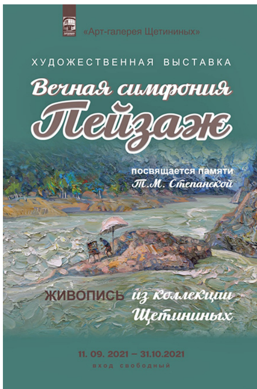
Рис. 3. Афиша выставки «Вечная симфония – пейзаж» (2021)

тельно и радостно демонстрирует выставка ” Живая вода Алтая“. Живопись из коллекции Щетининых» [6, с. 41].