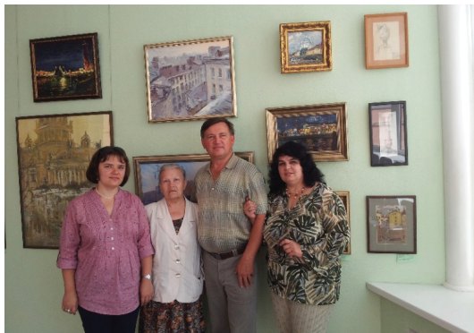
Рис. 2. Выставка «Свет реализма» в Арт-галерее Щетининых. Барнаул (2013)

телей и художников общение с подобными экспозициями важно, так как приводит к открытию целого пласта сибирского художественного наследия, созданного в ушедшем веке» [3, с. 20].