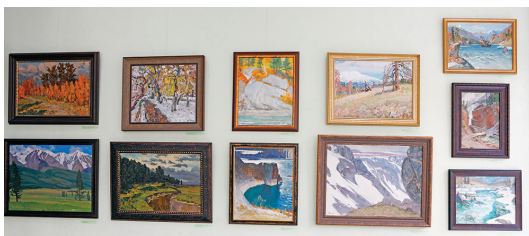
Рис. 5. Фрагмент экспозиции «Вечная симфония – пейзаж» (2021)