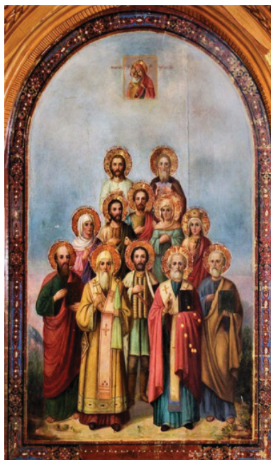
Рис. 5. Икона в память 300-летия царствования дома Романовых. В верхней части помещена Феодоровская икона Божией Матери. Михайло-Архангельский храм Рубцовска

Предстоит большая и интересная работа по атрибуции и исследованию этих вещей, чудом сохранившихся в Рубцовске. Эти уникальные музейные экспонаты представляют немалый интерес для ценителей русской культуры. Как и так называемая Юбилейная школа Рубцовска, хранящая память об императоре и самодержце всероссийском Николае II (20.10/1.11.1894–2/15.03.1917). Когда 1897 году на юге Западной Сибири отмечалось 150-летие Алтайского округа, его жители были щедро одарены «государевыми милостями». Среди «подарков крестьянам-переселенцам», «даров горожанам и служащим», «милостей горнозаводчанам» – 20 тыс. руб. на постройку церквей в 10 посёлках Алтайского округа и 12 тыс. руб. на строительство школьных зданий в 30 посёлках.