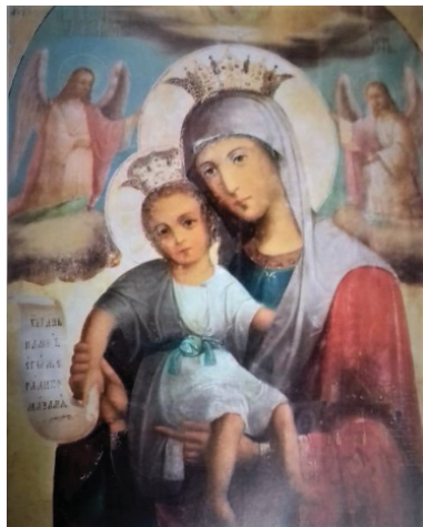
Рис. 8. Икона Богородицы «Достойно есть». Рубеж XIX–XX веков

В настоящее время отделом религиозного образования и катехизации епархии ведётся активная исследовательская работа по восстановлению