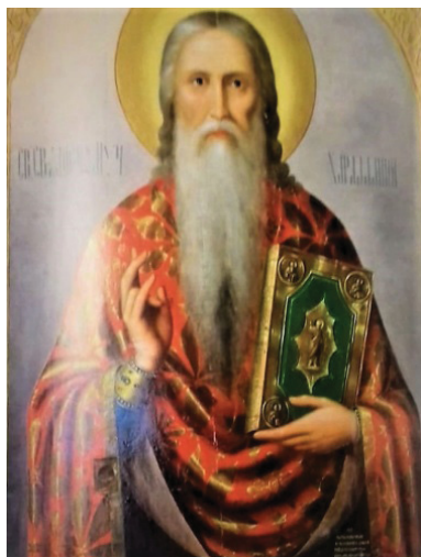
Рис. 10. Икона священномученика Харалампия, епископа Магнезийского (1912). Церковь в честь Рождества Христова и святителя Николая Чудотворца города Рубцовска