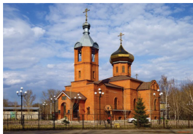
Рис. 9. Церковь в честь Рождества Христова и святителя Николая Чудотворца. Рубцовск