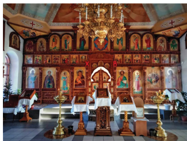
Рис. 11. Иконостас церкви Рождества Христова и святителя Николая Чудотворца

имён репрессированных священников. В кафедральном соборе размещена действующая выставка архивных фотодокументов о последних днях жизни людей, расстрелянных на Рубцовской земле.