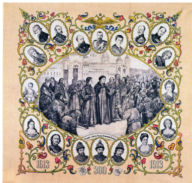
Рис. 6. Платок «300-летие дома Романовых. 1613–1913». Музей Рубцовской и Алейской епархии