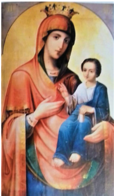
Рис. 7. Иверская икона Божией Матери. Рубеж XIX–XX веков

Благодаря этим финансовым вложениям в засёлке Рубцовском была выстроена первая школа, которая открылась 9 апреля 1901 года. Здание школы сохранилось по адресу: ул. Советская, 8 [11, с. 207–212].