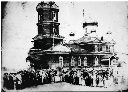
Рис. 2. Кафедральный собор в честь Михаила Архангела (1 января 1929 года)

Сегодня Михайло-Архангельский храм – это крупный епархиальный комплекс, включающий в себя не только церковное помещение для богослужений и молитв, но и воскресную школу для детей и взрослых, православный музей и библиотеку [9]. Кафедральный собор, получивший в 2005 году статус охраняемого памятника истории и архитектуры с занесением в государственный реестр памятников архитектуры, отличается архитектурно-художественными особенностями. Он возведён в традиционной для конца