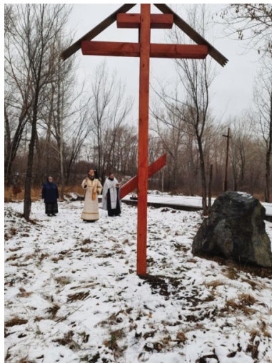
Рис. 12. Панихида по жертвам политических репрессий у поклонного Креста в Редькиной забоке

Разные виды культурно-познавательного туризма могут внести свою лепту в развитие экономики города и региона. Наблюдения положительной динамики в этом направлении уже зафиксированы современными исследователями в других малых и средних городах России. А рубцовские объекты духовного и историко-культурного содержания могут стать заметной частью туристского брендинга территории.