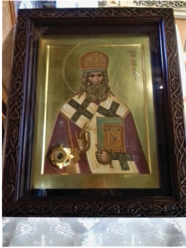
Рис. 4. Икона святителя Макария Алтайского с частицей мощей, Михайло-Архангельский храм Рубцовска

XIX века церковно-строительной манере, но с сибирской простой формой; деревянный, по форме – неф («корабль»), семиглавый, стоит на каменном фундаменте.