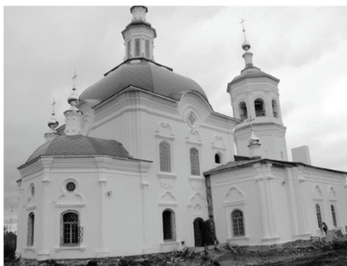
Рис. 3. Тобольск. Андреевская церковь (фото Е.В. Ходаковского, 2010)

Четверик Андреевской церкви перекрыт восьмилотковым сводом — более крутым, нежели у Архангельской церкви, и с изломом в верхней части, что особенно сближает его с вятскими курмами. Венчание и композиция фасадов близки Архангельскому храму — есть и фонарь с пи-