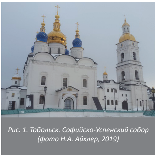
Рис. 1. Тобольск. Софийско-Успенский собор (фото Н.А. Айхлер, 2019)

Самым главным храмом в городе в настоящее время является Софийско-Успенский собор (рис. 1). В качестве образца для строительства собора вместе с царской грамотой в Тобольск были присланы сметные росписи, обмеры и чертежи Вознесенского монастыря в Московском Кремле. Основной кубический объем храма завершился закомарами и был увенчан пятиглавием [7].