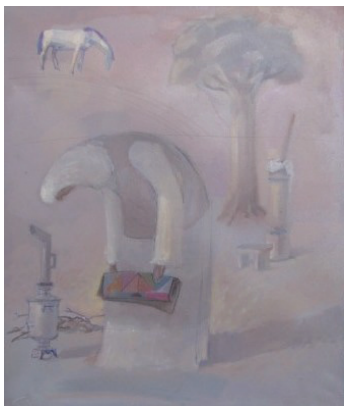
Рис. 3. Д. Магзумов. «Әжемнің таңы», 2008 г.