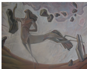
Рис. 5. Д. Магзумов. «Аспан үні», 2011 г.

Такое көрпе в традиционной культуре казахов олицетворяет собой Вселенную, макрокосм в миниатюре. Сшивая яркие тканевые лоскутки в единое полотно для көрпе, казахские женщины словно оживляли архаичные мифы творения, каждый раз повторяя ритуал, где Творец-Тенгри создает солнце, луну, радугу, дождь, облака, цветы и все вокруг. Так и Әже начинает свой день с акта творения. Она каждое утро осуществляет обыкновенное волшебство, соединяя лоскутки сиюминутных со-