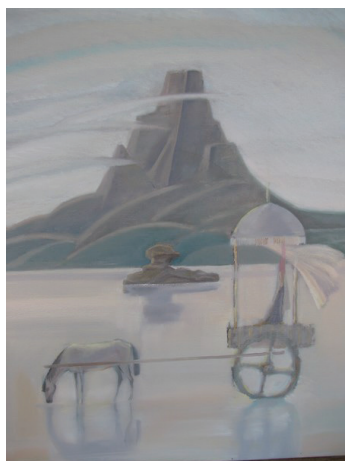
Рис. 1. Д. Магзумов. «Күміс күйте». 2008 г.

Сама природа Көкше использует художественный прием, изменяющий изображения природных объектов в зависимости от ракурса, угла зрения воспринимающего. Поэтому мы говорим, что природные об-