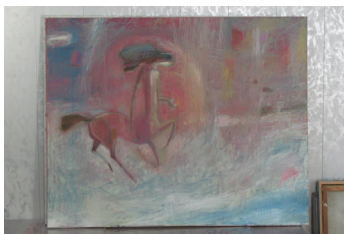
Рис. 4. Д. Магзумов. «Кентавр». 2010 г.

разы Көкше сами диктуют художнику правила метафорической трансформации его художественных образов.