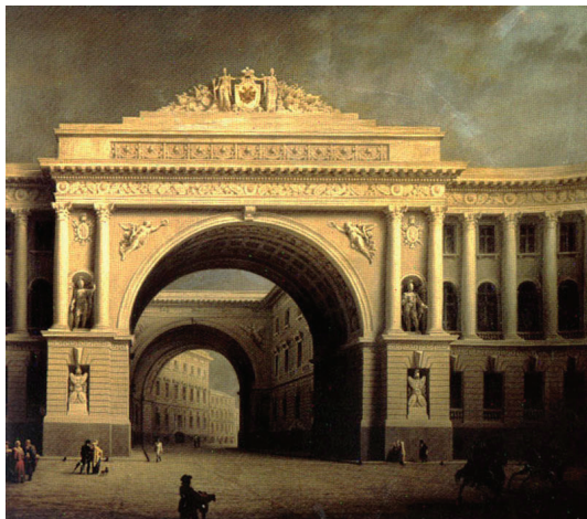
Рис. 1. А. Каноппи. Арка Главного штаба со стороны Дворцовой площади.