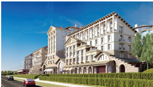
Рис. 3. М.А. Филиппов. Современная неоклассика. «Римский квартал» под Москвой. Перспектива.

Современная архитектурная стилистика строится на отрицании пуризма предшествующего моностилия и всё чаще обращается к неоклассике в её современной трактовке. В связи с этим опыт перехода от классицизма к эклектике и историзму в архитектуре первой половины XIX – начала XX века с её теоретическими и практическими опы-