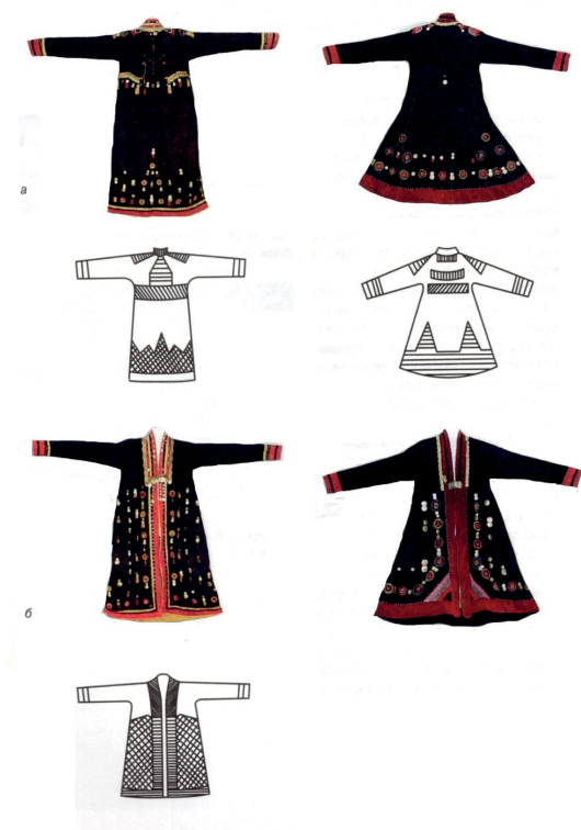
Рис. 2. Мотив гор в декоре башкирской народной одежды: вид сзади (верхние ряды) и вид спереди (нижние ряды)

его ответственности за совершённые поступки, и роли Смерти в жизненном цикле Вселенной. Бессмертие, заключённое в воде Живого родника, дорогу к которому знала Богиня Хумай – дочь царя Самрау и Солнца, по первоначальному замыслу должно было дать вечную жизнь народу Урала. Однако старец, обречённый на вечное существование и видевший в этом своё несчастье, отговорил Урал-батыра. Узрев мудрость в словах старца, Урал-батыр разбрызгал воду из Живого источника на горы и деревья, животных и растения, «обессмертив» таким образом природу.