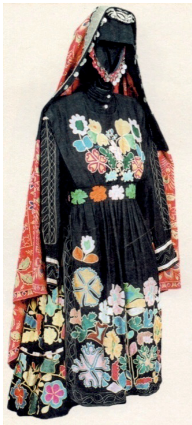
Рис. 1. Традиционный костюм северо-восточных башкир

В эволюции взаимоотношений человека с природой, тысячелетиями определявших формирование мировоззренческих взглядов современного населения земли, отчётливо выделяется длительный путь от беспрекословного признания абсолютной власти природы над человеком до осознания хрупкости природного баланса и необходимости её защиты от единственного «разумного» существа, наделённого способностью воспроизводить мыслительные операции, не свойственные животному организму. В этой исторической цепочке качественных переходов сознания особо выделяется эпоха тенгрианства – период, в течение которого человек не просто пони-