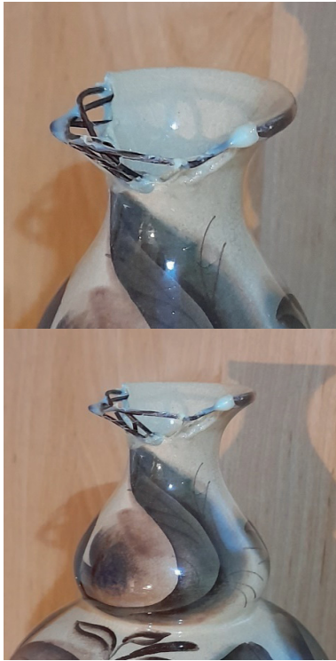
Рис. 3. Воссоздание каркаса горлышка вазы

небольшие отверстия по намеченным точкам. Первоначально создаём основную часть – опорные горизонтальные стяжки из проволоки. Вставляем в отверстия проволочки, точно отмеренные по длине, осторожно вклеиваем их, даём высохнуть и закрепиться (рис. 3). После полного высыхания клея аналогичным способом выполняем вертикальные опоры из проволоочки, осторожно обвязывая ими горизонтальные, и вклеиваем их в подготовленные отверстия. Для усиления прочности можно ещё раз густо промазать поверхность проволочного каркаса клеем и хорошо просушить.