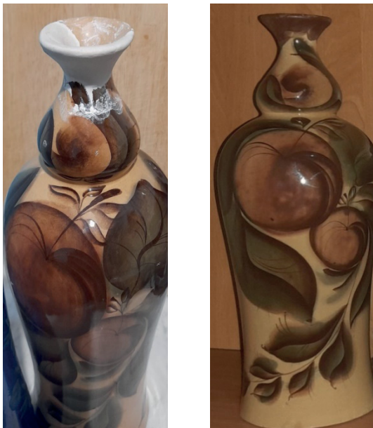
Рис. 4. Восстановленное горлышко вазы

В результате реставрации мы не добились первоначального вида изделия, но вернули внешний вид и образ предмету декоративно-прикладного искусства. Безусловно, восстановленную вазу нельзя будет активно эксплуатировать, но её воссозданная первоначальная форма будет радовать глаз, служить украшением интерьера. Процесс реставрации – актуальная и востребованная деятельность, так как восстановление старинных вещей, которые могут и не представлять интереса с точки зрения истории и искусства, но часто они дороги для конкретного человека.