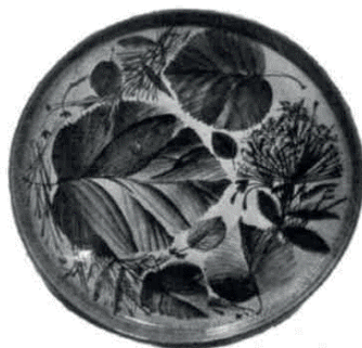
Рис. 2. Кириленко Н.П. Декоративные тарелки. Глина, ангоб, подглазур. Краски. 1984