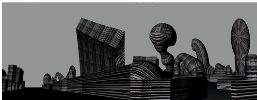
Рис. 3. «Деревня дураков». Арт-резиденция в Кольвани. 2013