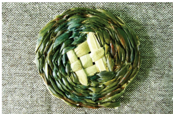
Рис. 4. Комбинированная техника