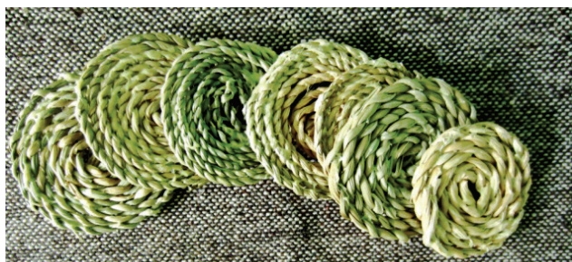
Рис. 3. Техника «веревочка»