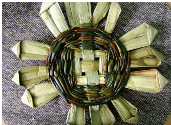
Рис. 6. Элементы декора костюма (техника «оригами», «веревочка», «шахматка»)

Низ безрукавки оформлен большими по размеру цветами, имитирующими цветы подсолнуха. Лепестки цветов заложены по принципу «оригами», середина выполнена в технике «шахматка», поверх которой заплетен тонированный более насыщенными оттенками жгут (рис. 6).