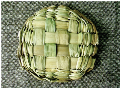
Рис. 2. Техника «шахматка»