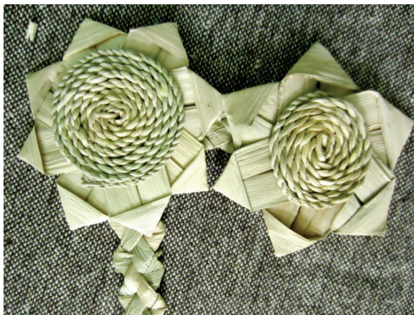
Рис. 5. Элементы декора костюма (техника «оригами», «веревочка», «зубатка»)

В верхней части ансамбля, на «епанечке» в виде зигзагообразной линии расположены небольшие цветы, лепестки которых выполнены из листьев рогоза и заложены по принципу «оригами» (рис. 5). Середина цветка — круглая, из сплетенной «веревочки». Соединение цветов между собой происходит в результате линии, сплетенной в технике «зубатка».