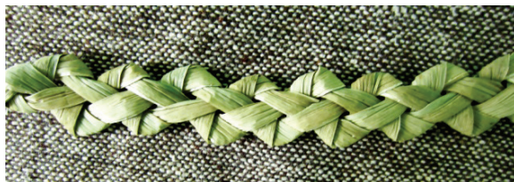
Рис. 1. Техника «зубатка»

Совмещение различных приемов плетения не только рогоза, но и других материалов (ивы, соломы, бересты и т. п.) позволяет значительно расширить декоративное наполнение элементов [2].