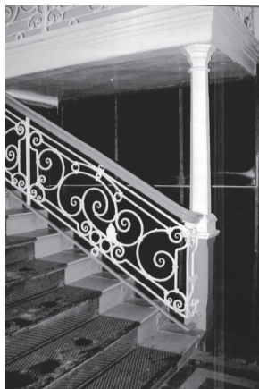
Канцелярия Кольванов- Воскресенских заводов в Барнауле. Фрагмент интерьера