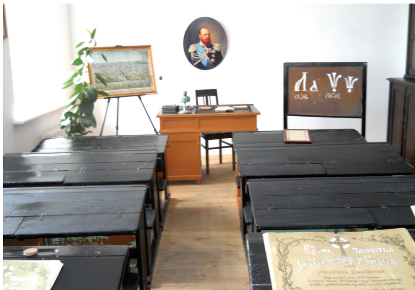
Рис. 2. Реконструкция внутреннего убранства церковной школы в музее Алтайской духовной миссии. Бийск