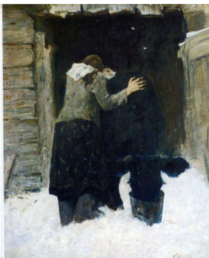
Рис. 1. И.С. Хайрулинов Тяжкая весть. 1982 год. 1982. Х., м. 184x152.

В моих руках небольшая брошюра-альбом «О войне и мире» художника Ильбека Хайрулинова. Репродукции картин, немного текста. Переверачиваю страницу, другую, и... дыхание моё перехватывает, изображённое