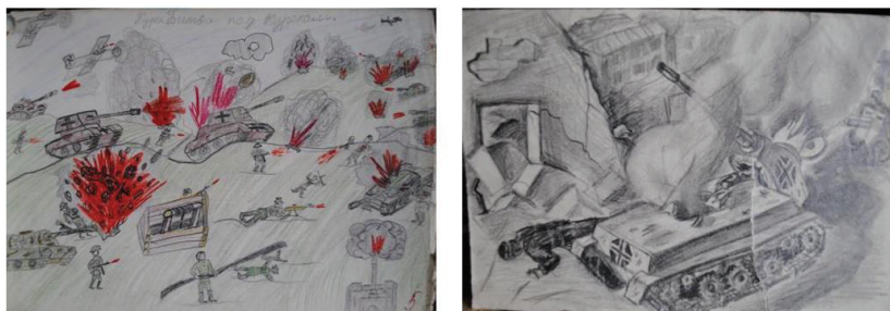
Рис. 2. Роберт Хайрулинов, 6 класс. Курская битва. Подбитый танк.