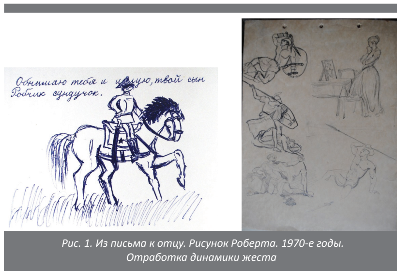
Рис. 1. Из письма к отцу. Рисунок Роберта. 1970-е годы. Отработка динамики жеста