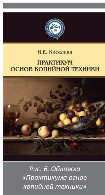
Рис. 6. Обложка «Практикума основ копийной техники»

Специалист-искусствовед может реализовать свои знания и умения и как педагог. Приобщение к творчеству мастеров происходит не только посредством беседы педагога в мастерской, библиотеке, музее. Одной из форм является и практическое занятие по копированию художественных произведений. «Практикум основ копийной техники» может стать надёжным помощником педагогу-искусствоведу в освоении методики проведения этих занятий.