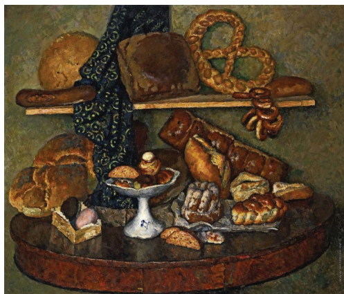
Рис. 5. Копия с репродукции И. Машкова «Снедь московская. Хлебы».

Копировать нужно, это приносит несомненную пользу студентам, приобщает будущих искусствоведов к практическим занятиям, позволит им с профессиональной точки зрения оценивать произведения искусства.