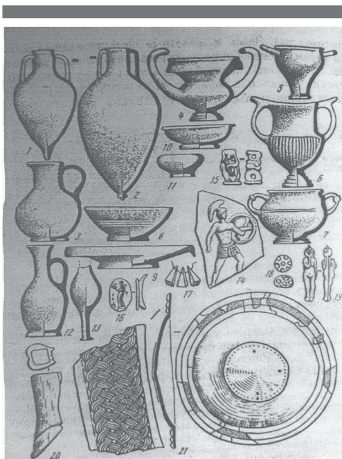
Рис. 1. Диоскуриада. Привозная продукция греческих мастеров

На всем Закавказье, и в Абхазии в частности, рано появилось и получило широкое распространение ремесло, связанное с железом. Раскопки в районе как современного Сухума, так и в других пунктах нынешней Абхазии показали, что уже в IX–VIII вв. до н.э. местное население широко пользовалось железом для изготовления орудий труда и оружия. В памятниках V–IV вв. до н.э., например, в некрополях на Сухумской горе, на горе Гуадику и в Красномаяцком, совершенно отсутствует бронзовое оружие. Этот факт говорит об окончательном переходе к середине I тыс. до н.э. от бронзы к железу [2, с. 236]. В этой связи нужно подчеркнуть, что металлообрабатывающее ремесло