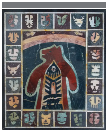
Рис. 1. А. Биттер Дух – хозяин тайги – медведь