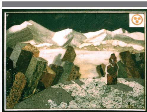
Рис. 5. А. Биттер. Ночной пейзаж ночью. Алтай

Масштабность реализованного проекта потрясает не только неиску-