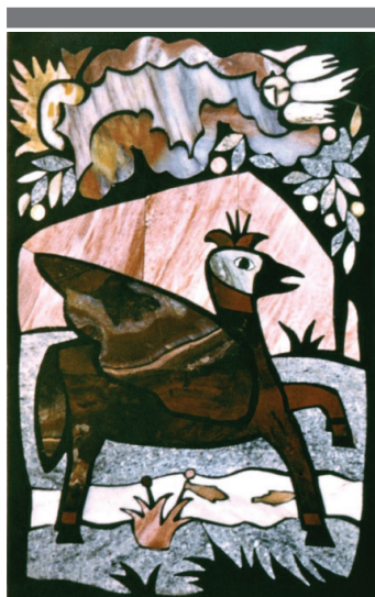
Рис. 3. А. Битгер. Грифон

На тему языческих ритуалов и дохристианского фольклора в камне в стиле флорентийской мозаики А. Битгером были выполнены камерные композиции: «Сирин», «Грифон» (хранитель сокровищ гор), «Грифон со всадником», «Ряженный», «Уличный театр», «Мужик и медведь», «Ряженные», «Охотник