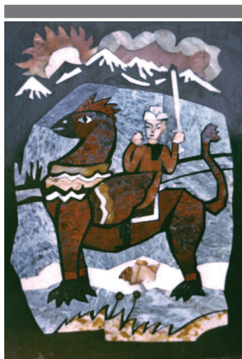
Рис. 4. А. Битгер. Грифон со всадником