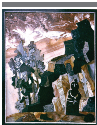
Рис. 7. А. Биттер. Эхо прошлого. Идол