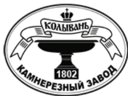
Рис. 9. Логотип А. Биттера

Мозаики выполнены в 1989 году на Колыванском Камнерезном Заводе им. И.И. Ползунова