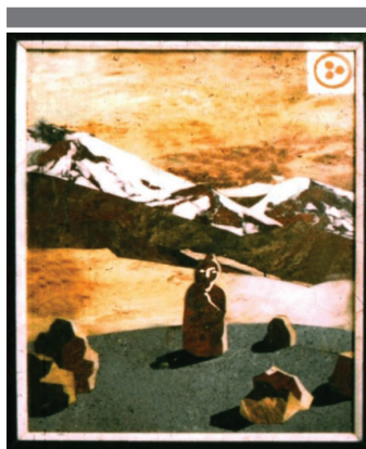
Рис. 6. А. Биттер. Пейзаж с каменным Идолом

Нам удалось выяснить, что по решению Правления Алтайской организации СХ РСФСР художника А.А. Биттера направляли для обучения в Дом творче-