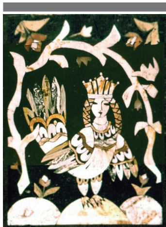
Рис. 2. А. Биттер. Сирин

В проектах для флорентийских мозаик [3] художник искал, кроме традиционных мотивов флоры и фауны (пейзажи, животные), новые темы, к которым относятся языческие мотивы, воплотившиеся в работах «Алтайская чуждь» и «Скифский звериный стиль» [4], шаманство с его ритуалами, «Алтай и Н. К. Рерих и его философия», христианство (библейские сюжеты), русская народная культура, ее фольклор и традиции.