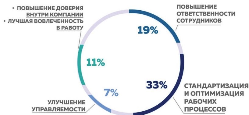
Рисунок 2 — Основные выгоды от внедрения на предприятии системы менеджмента качества и сертификации по ISO 9001:2015