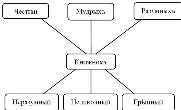
Рис. 1. Термы топа «противоположное» во вступлении

2.2. Противоположное: «...азъ, грѣшный паче всѣхъ и неразумный и не школьный человекъ, всѣхъ мудрыхъ и разумныхъ, и прилежащихъ философіи, и глаголющихъ, яко нынѣ взыскахомъ въру праву и нынѣ обрѣтохомъ, и ко книжному исправленію умудрихомся добръ» (МДИР, т. 6, 1881, с. 1). Последовательность прилагательных в приведенном выше фрагменте образует симметрию. Честнии, мудрыхъ и разумныхъ противопоставлены в контексте грѣшный, не школьный, неразумный , однако эта симметрия-антитеза имеет основание в виде единицы книжному .