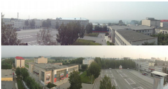
Рис. 2. Территория Новосибирского военного института имени генерала армии И. К. Яковлева ВНГ РФ в Новосибирске и Искитиме [7]