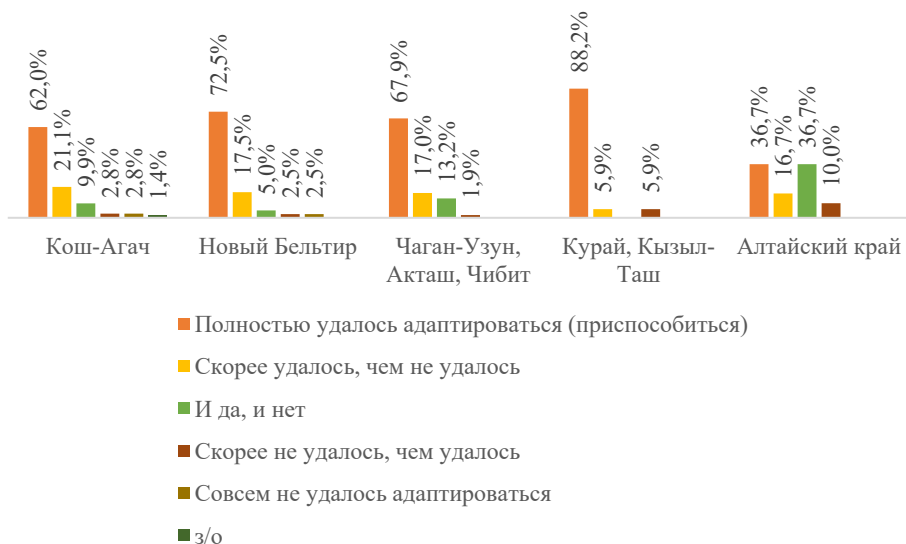
Рисунок 2 – Распределение ответов на вопрос: «В какой степени Вам удалось адаптироваться (приспособиться) к современным условиям жизни, включая новые природно-климатические условия?», в зависимости от места проживания, %

Уровень адаптации и приспособленности, равно как и оценка защищенность от разного рода угроз, будет определять уровень социального оптимизма и формировать полюс социальных ожиданий. Обратим внимание, что почти половины участников исследования смотрят в будущее с надеждой и оптимизмом (47,9%), еще пятая часть (21,8%) – с тревогой и неуверенностью, тогда как довольно существенная часть респондентов пессимистично настроены – 16,1% – смотрят в будущее с тревогой и неуверенностью, а 10,9% – со страхом и отчаянием.