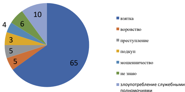
Рис. 1. Что для вас коррупция?, %

Безусловно, коррупция приобрела такие масштабы, стала столь массовой, что в обществе не ослабевает внимание, направленное на решение вопросов борьбы с коррупцией. В рамках исследования респондентам предлагалось выявить отношение к проблеме коррупции; выявить уровень знаний по данной проблеме; выявить предложения по борьбе с коррупцией (рисунок 1). С учетом полученных данных мы можем сделать вывод о том, что большинство респондентов выявили, что коррупция – это взятие взятки (65%), злоупотребление служебными полномочиями (10%).