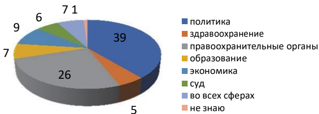
Рис. 2. Какая самая коррумпированная сфера общественных отношений, %

Также у респондентов спрашивалось о том, какую сферу общественных отношений они считают самой коррумпированной? С учетом полученных данных, мы можем сделать вывод о том, что большинство респондентов выявили, что самой коррумпированной сферой общественных отношений является политика (39%), правоохранительные органы (26%) (рисунок 2).