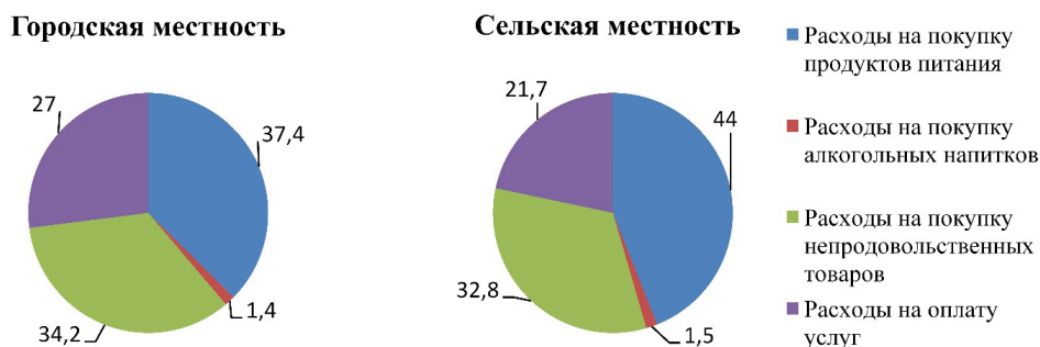
Рисунок 1 — Структура потребительских расходов домашних хозяйств по месту проживания в 2021 г., %.

Данные официальной статистики фиксируют и различия в уровне потребительских расходов населения на покупку продуктов питания в зависимости от территории проживания. Так, доля расходов на продовольственные товары в городской местности ниже, чем в сельской (37% против 44%; рис. 1). Причем за последний год среди городского населения наблюдалось снижение доли расходов на продукты питания (с 41 до 37%) за счет увеличения удельного веса расходов на покупку непродовольственных товаров (с 30 до 34%), в то время как в сельской местности существенных изменений не произошло.