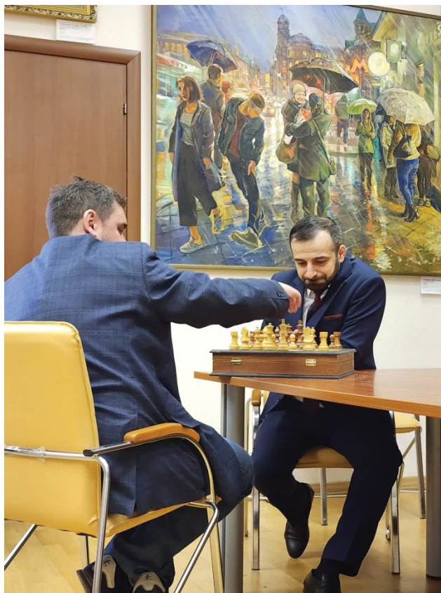
Рисунок 4 — Аспиранты в перерыве конференции

КГМА им. И. К. Ахунбаева (Кыргызстан), Высшей гуманитарной школы (Казахстан). Дискуссия на секции выстраивалась вокруг тем национальной безопасности и пространственных аспектов евразийской интеграции, миграционных процессов, межкультурных коммуникаций, новых культурных идентичностей, религиозных и духовных ценностей.