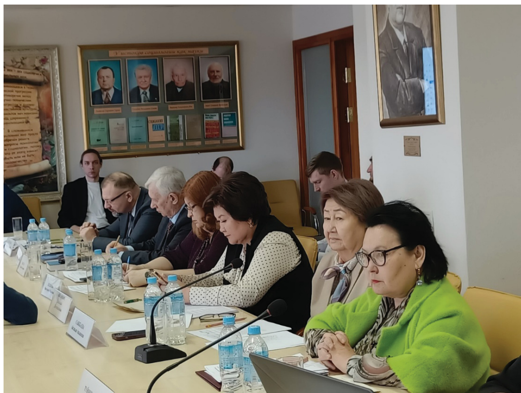
Рисунок 2 — Работа конференции

На конференции приняли участие ученые из Армении, Афганистана, Беларуси, Венгрии, Кубы, Кыргызстана, Македонии, Пакистана, России, Таджикистана, Узбекистана и др.