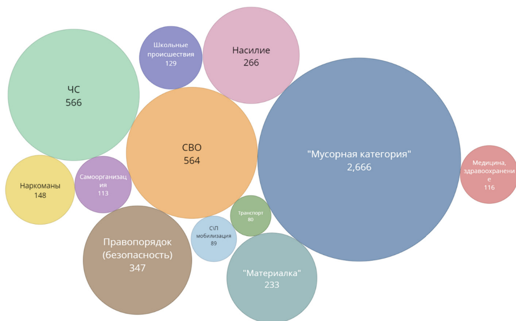
Рисунок 3 — Укрупненная тематическая группировка повестки сетевых сообществ в период с января по декабрь 2022 г. (Кузбасс, Тюменская область, ручная сортировка тематических групп).