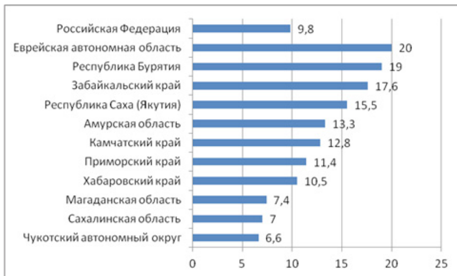
Рисунок 2 — Численность населения с доходами ниже границы бедности на начало 2023 г., процент от общей численности населения. 1

К великому стыду нашего государства, в XXI в., когда цивилизованный мир переживает постиндустриальную эпоху, практически 1/5 часть населения многих регионов живет (точнее, существует) в нищете (рис. 2).