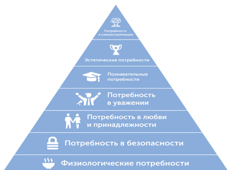
Рисунок 1 — Пирамида потребностей А. Маслоу.

Состояние и развитие человеческого капитала значительно зависит от степени удовлетворения потребностей людей, исходя из иерархии потребностей (рис. 1).