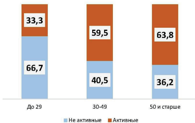
Рисунок 4 — Взаимосвязь между принадлежностью к кластеру активных или неактивных граждан и возрастом респондента, %