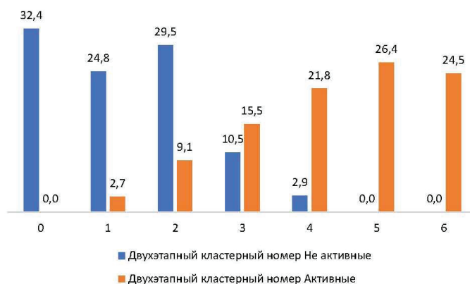
Рисунок 1 — Сравнение количества форм проявления социальной активности в разных кластерах, %