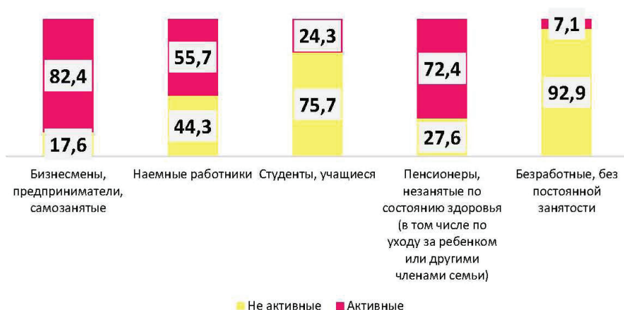
Рисунок 5 — Взаимосвязь между социальной активностью (по результатам кластерного анализа) и социально-профессиональным статусом, %