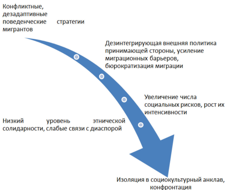
Рис. 2. Формирование дезадаптивного сценария жизнедеятельности мигрантов