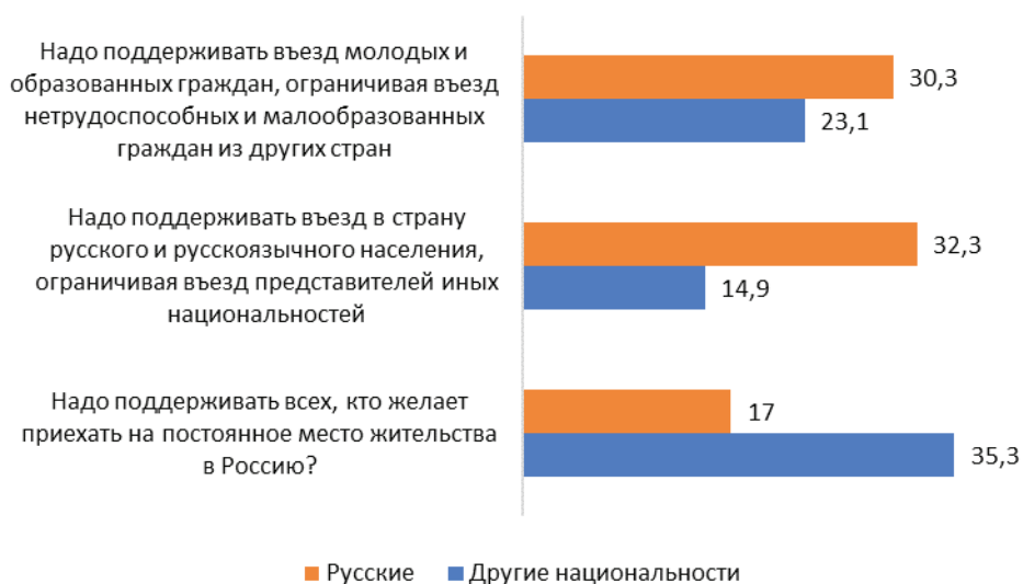
Рисунок 3 — Отношение населения к различным миграционным стратегиям в зависимости от национальной принадлежности, %

Общественное мнение неоднородно, значительное влияние на предпочтения и ожидания граждан оказывают социоструктурные факторы, связанные с социальным, экономическим и территориальным расслоением регионального общества. Так, за поддержку всех мигрантов, желающих приехать в Россию на постоянное место жительства, чаще высказывались респонденты с высшим образованием (26,4%, в группах с более низкими образовательными уровнями — 18,7%) и более высоким уровнем доходов (в группе «достаточно обеспеченных, богатых» — 39,5%, группах с низкими доходами 27,6%, средними — 17,7%) 1 . Городские жители значительно чаще, чем жители села, соглашались с утверждением о необходимости поддержки молодых и образованных мигрантов и введения ограничений для нетрудоспособных и малообразованных (33,5% по сравнению с 19,8%). Подобная оппозиция мнений была характерна и для респондентов разных возрастных групп: молодежь и респонденты среднего возраста значительно чаще поддерживали политику отбора «нужных стране» мигрантов (35,7% и 31,3%), чем респонденты старшего возраста (19,5%).