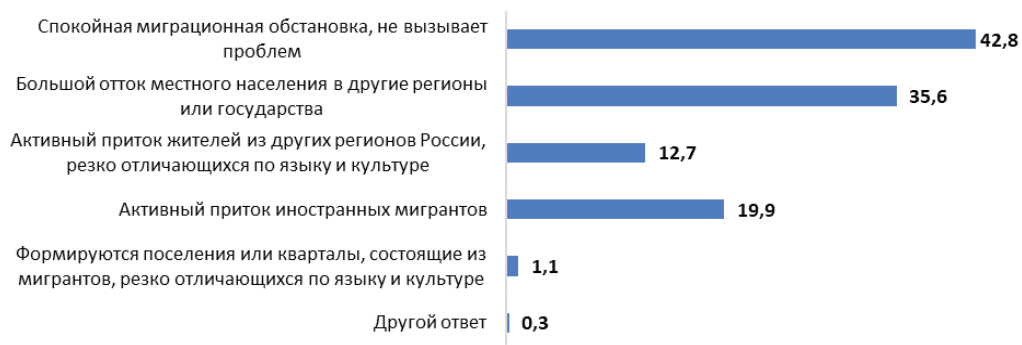
Рисунок 1 — Оценка населением миграционной обстановки в регионе, %

Миграционная ситуация в Алтайском крае оценивается населением как сходная с другими регионами России: по мнению 34,3% опрошенных, в Алтайском крае приезжих столько же, сколько в других регионах России, 16,8% — считают, что их немногим меньше, 9,8% — что их немногим больше, при этом большинство мигрантов, по мнению населения, — это лица другой национальности, чем национальность местного населения, т.е. мигранты воспринимаются не только как граждане другой страны, но и как этнически «чужие». Наиболее многочисленными, по мнению опрошенных, являются группы мигрантов из Таджикистана (55,7% ответов), Казахстана (50,4%), Узбекистана (49,4%), Армении (43,4%), реже всего респонденты упоминали корейцев (3,0%), турок (2,1%), белорусов (1,7%) и молдаван (1,5%).