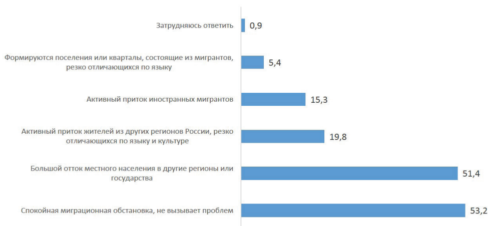
Рисунок 1 — Распределение ответов на вопрос «Оцените характер миграционной обстановки в вашем регионе», %

тернативу выбрали практически в половине случаев. Реже всего ситуацию в данной области оценивают как спокойную в Амурской области (25,0%) и Хабаровском крае (8,6%). В данных регионах эксперты значительно чаще отмечают большой отток населения в другие регионы или государства. Эксперты до Хабаровского края чаще других также отмечают активный приток иностранных мигрантов в регион (25,7% случаев — по сравнению с 5,0–6,7% случаев в других регионах). Выявленные различия статистически достоверны ( \alpha \leq 0,0001 согласно \chi^2 ).