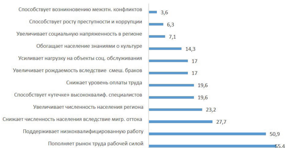
Рисунок 2 — Распределение ответов на вопрос «Как, по вашему мнению, влияет миграция населения на ситуацию в вашем регионе?», %

фликтов (рис. 2). При анализе ответов на данный вопрос значимых региональных различий выявлено не было.