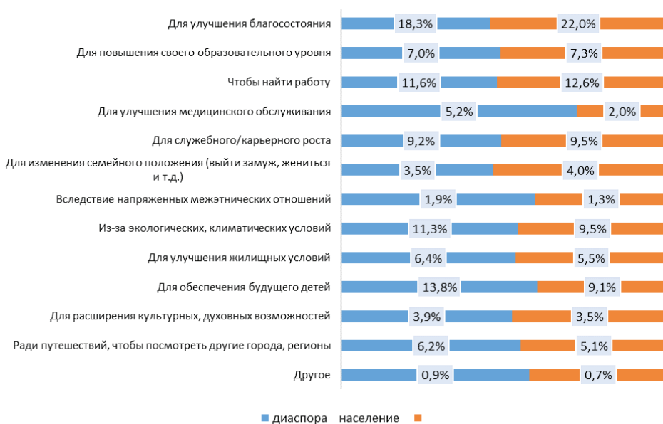
Рисунок 1 — Структура мотивов транзитных миграций постоянного населения Российской Федерации, множественные выборы, %

Что направляет мигранта на дальнейший транзит — мечта о лучшей жизни, поиск более выгодных условий труда, недостижимые идеалы, какая-то иная мечта, стереотипные представления об обществах и государствах «всеобщего благоденствия»? Т.е. причины субъективного характера? Либо существуют причины социального, культурного, политического или иного характера, которые движут мигрантом? Причины, которые латентно формируют установку на транзит, обосновывая перемещение экономическими мотивами? Или прошлый опыт миграции убеждает индивида в том, что все возможно, что он в силах изменить свой жизненный путь, снижая восприятие рисков, связанных с миграцией? Или же причиной служит сам приграничный характер региона, где близость границ — не только физических, но культурных, экономических и мировоззренческих — опять-таки формирует установку на более безопасное и «прозрачное» для самого мигранта перемещение?