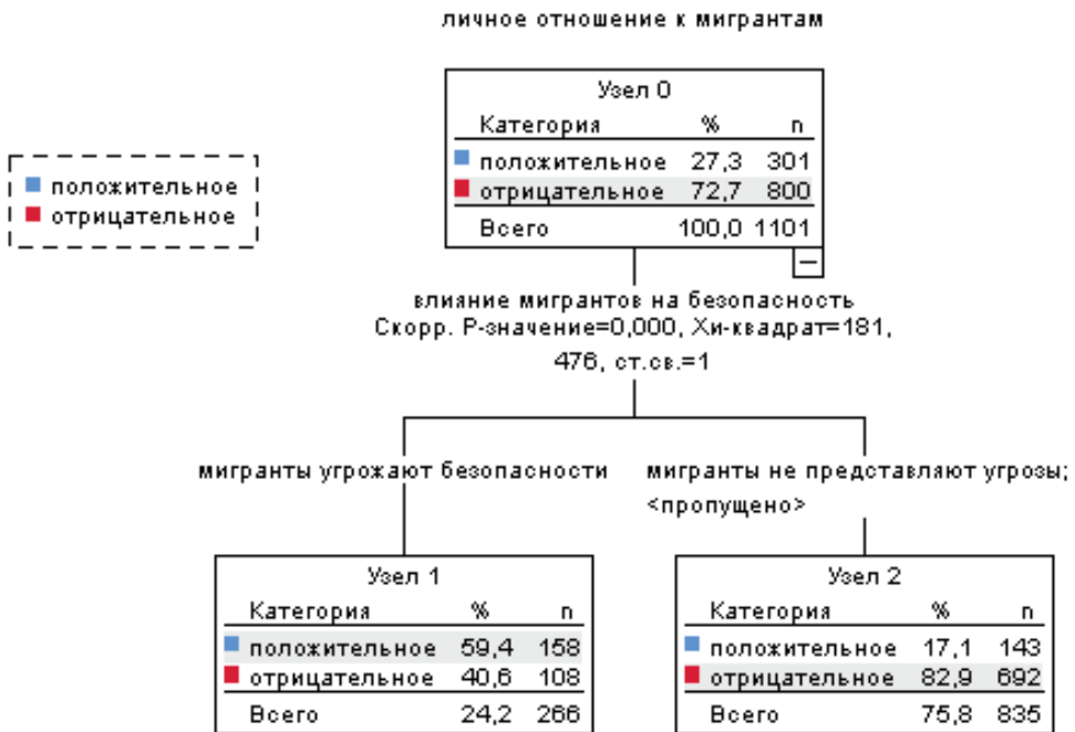
Рисунок 3 — Дерево решений для предсказания характера отношения к мигрантам

Цель построения деревьев классификации заключается в предсказании (или объяснении) значений категориальной зависимой переменной, что позволяет последовательно изучать эффект влияния отдельных переменных. Способность деревьев классификации выполнять одномерное ветвление для анализа вклада отдельных переменных дает возможность работать с предикторными переменными различных типов. В качестве зависимой переменной использована отражающая личное отношение к мигрантам (для удобства восприятия мы суммировали положительные и скорее положительные, отрицательные и скорее отрицательные оценки, чтобы сместить предсказания к тому или иному полюсу). В качестве предикторов — принадлежность к возрастной группе, наличие детей, семейное положение, уровень образования, уровень материального достатка, гендерный статус, оценка влияния мигрантов на безопасность, отношение к религии.